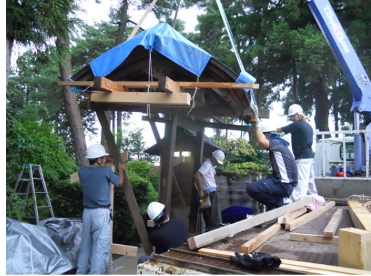
表門現地組立て（建築大工コース）