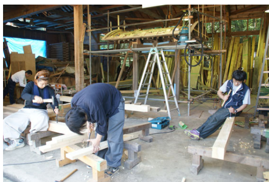
控柱・袖扉の新材加工（建築大工コース）