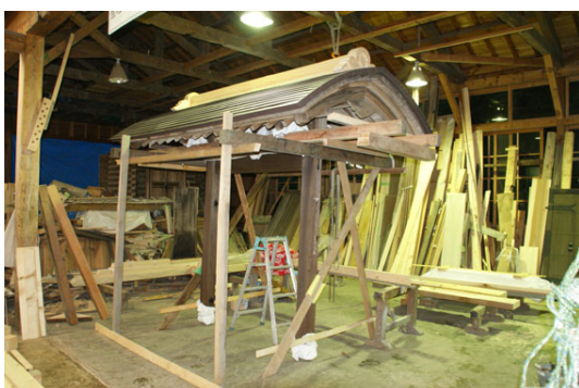
表門組立て・美装