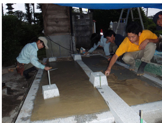
基礎・石工事（環境職藝科）