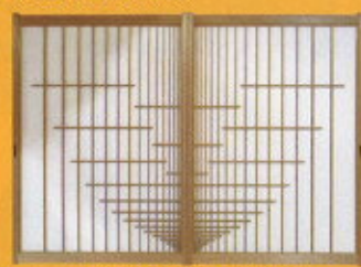
切り変り組み中連障子